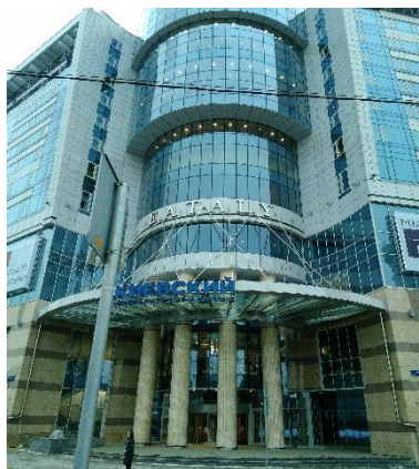
Рис. 1 ТГК «Киевский»

Внимание, при посещении ВЦ Италии при себе необходимо иметь распечатанный лист «Информация о записи», оригинал гражданского паспорта. При входе в ВЦ на ресепшене необходимо взять талон электронной очереди, в зоне ожидания отслеживать очередь по номеру талона.